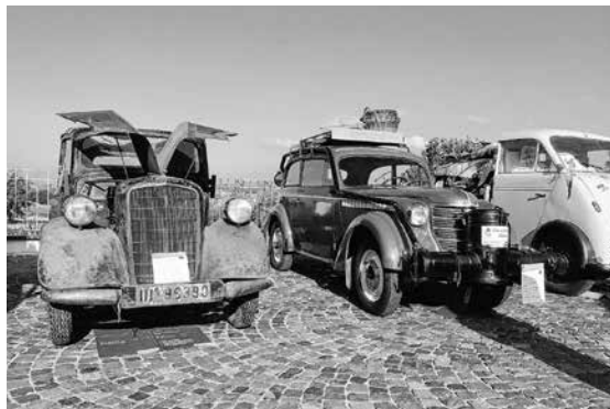
Opel 1,3 Cabrio Limousine u. Opel Olympia

Eine kleine Gruppe der Oldtimerfreunde-Ehningen besuchte vergangenes Wochenende das Patina Treffen am Auto & Traktoren Museum in Uhldingen/ Mühlhofen am Bodensee. Bei schönstem Wetter trafen sich am Samstag ca. 200 Fzg. auf dem Museumsgelände ein, das Museum ist immer wieder einen Besuch wert, denn es wird kontinuierlich erweitert bzw. mit neuen Exponaten versehen, so zuletzt der Autosammlung von Fritz B. Busch aus Wolfegg