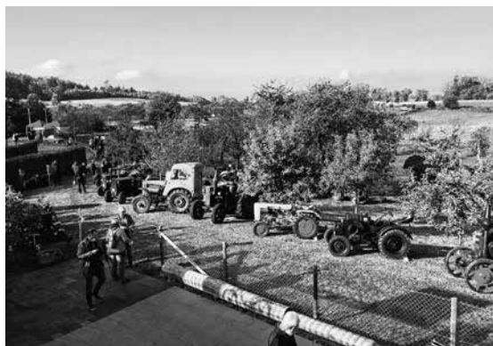
Blick über das Freigelände