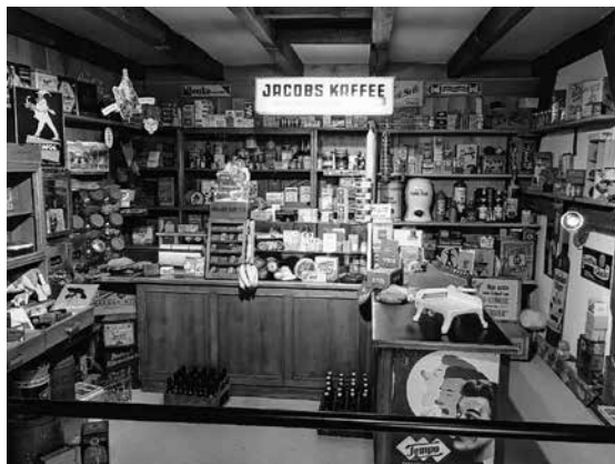
Tante Emma Laden im Museum