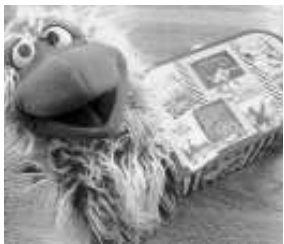
Unser Maskottchen Lehni freut sich schon auf den Start im Koffer eine tolle Geschichte

Die Schule stellt für diese Veranstaltung Räume zur Verfügung. Im Anschluss wird etwas gebastelt, damit die Kinder ein Andenken an den Nachmittag mit nach Hause nehmen können.