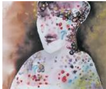
Bärbel Ecke: Fragen über Fragen

Die Ausstellung ist geöffnet am Sonntag, 21. November 2021, 11.30 – 17.00 Uhr.