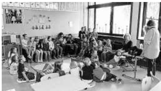
Wir suchen Leseratten, Basteltanten, Geschichtenbetreuer mit guten Ohren....

Helfen Sie mit, dass der Lesetreff wieder angeboten werden kann.