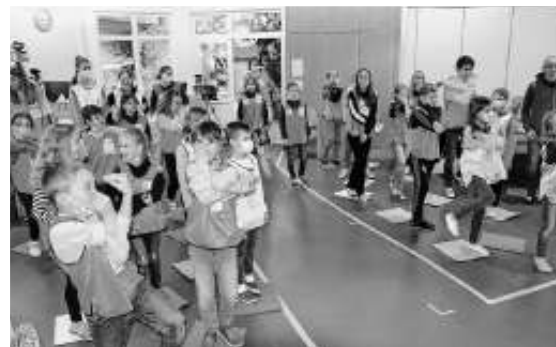
Viel Action ist angesagt

„Tierisch gut“ – so lautete das diesjährige Motto der Kinderferientage der Süddeutschen Gemeinschaft Ehningen. Aufgeregtes und fröhliches Kindergeschrei war vom 1. bis 3. November 2021 im Gemeinschaftshaus zu hören. Nachdem die Veranstaltung im vergangenen Jahr in Form eines Online-Programms stattgefunden hatte, war die Vorfreude auf gemeinsame Kinderferientage vor Ort umso größer. 50 Kinder der 1. bis 6. Klasse konnten wieder live von den rund 20 ehrenamtlichen Mitarbeitenden begrüßt werden.