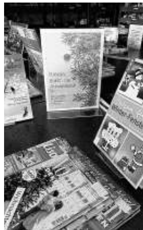
Nach der Vorleseveranstaltung musste der Medientisch auf der Empore wieder aufgebaut werden.

Nachmittags habe ich die Empore für den Vorlese-nachmittag für Senioren vorbereitet. Alle 2 Wochen wird in der Bücherei von Ehrenamtlichen für Senioren vorgelesen. In netter Runde wird sich ausgetauscht und bei Kuchen und einer Tasse Kaffee den kurzweiligen Texten gelauscht.