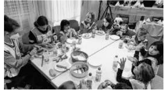
Mittagessen diesmal in kleinen Gruppen

Bei den anschließenden Workshops waren der Kreativität der Kinder keine Grenzen gesetzt – sie konnten Lichterschalen, „tierische“ Garderoben oder Dekorationen aus Dosen basteln, große Städte und Landschaften aus Bauklötzen bauen oder einfach gemütlich in der Lesecke entspannen. Für viel Action sorgten die Spiele im Freien, bei denen sich die Kinder so richtig austoben durften. Außerdem gab es die Möglichkeit, das eigene Können bei spannenden Duellen im Dominosteinebauen oder im Playmobil-Zielschießen unter Beweis zu stellen.