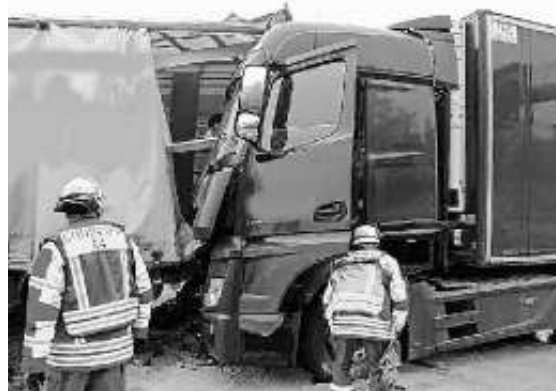
Verkehrsunfall auf der A81

Zur Unterstützung des Rettungsdienstes wurde die Feuerwehr Ehningen am frühen Abend alarmiert. Die Kräfte unterstützten beim Transport des Patienten in den Rettungswagen.