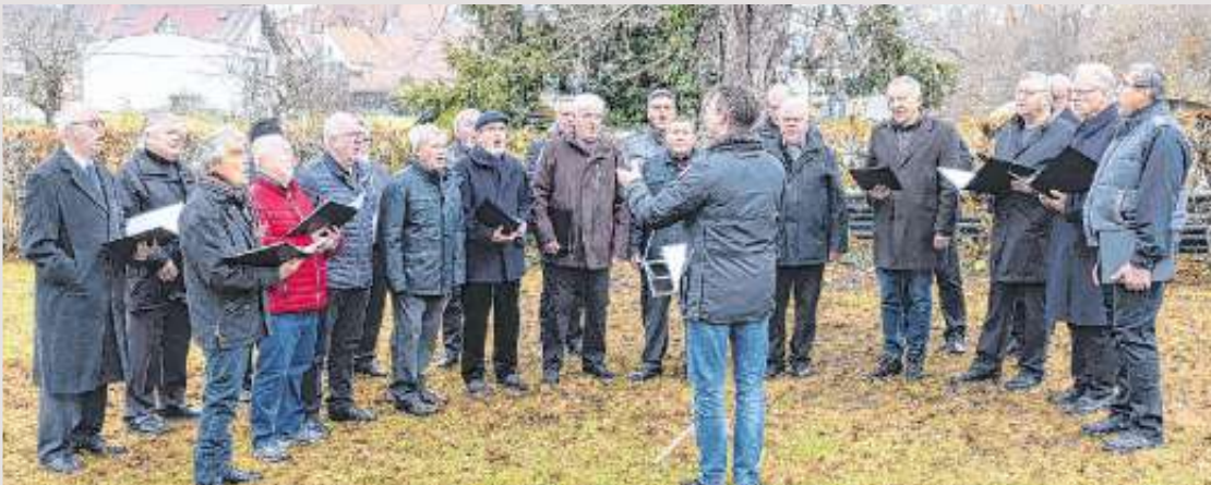
Am Sonntag, den 14. November 2021 fand die alljährliche Gedenkfeier zum Volkstrauertag vor dem Ehrenmal auf dem Friedhof an der Hildrizhauser Straße statt. Dieser wurde musikalisch und in würdiger Form umrahmt vom Liederkranz Ehningen.