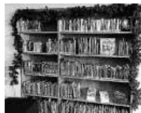
Ab jetzt können Weihnachtsmedien aller Art ausgeliehen werden

Auch Emails von Kunden der Bücherei habe ich beantwortet. Ich durfte den Maileingang bearbeiten, Medien von Kunden verlängern oder Vorbestellungen hinterlegen. In den kurzen Stunden meines ersten Praktikums Tages habe ich schon viele neue Dinge gelernt, von denen ich nicht gedacht hätte, dass sie zu den Aufgaben einer Bücherei zählen.