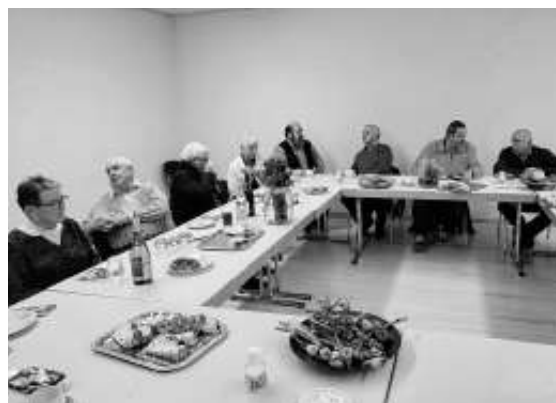
Gute Stimmung in kleiner Runde