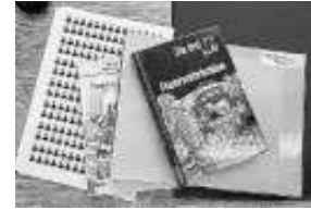
Jede Menge Aufkleber sind an den verschiedenen Bücher anzubringen

Ich habe auch kontrolliert ob die neuen Kinder- und Jugendbücher auf der Antolin-Plattform zu finden sind. Antolin ist ein Programm mit der das Leseverständnis abgefragt werden kann. Die Grundschule in Ehningen arbeitet ab der 2. Klassenstufe mit der Plattform und daher ist es wichtig, dass die Bücher der Bücherei mit dem Antolinraben gekennzeichnet sind. Antolin ist eine Quizprogramm. Man liest Bücher, beantwortet Fragen zu den gelesenen Büchern und erhält dafür am Ende Punkte.