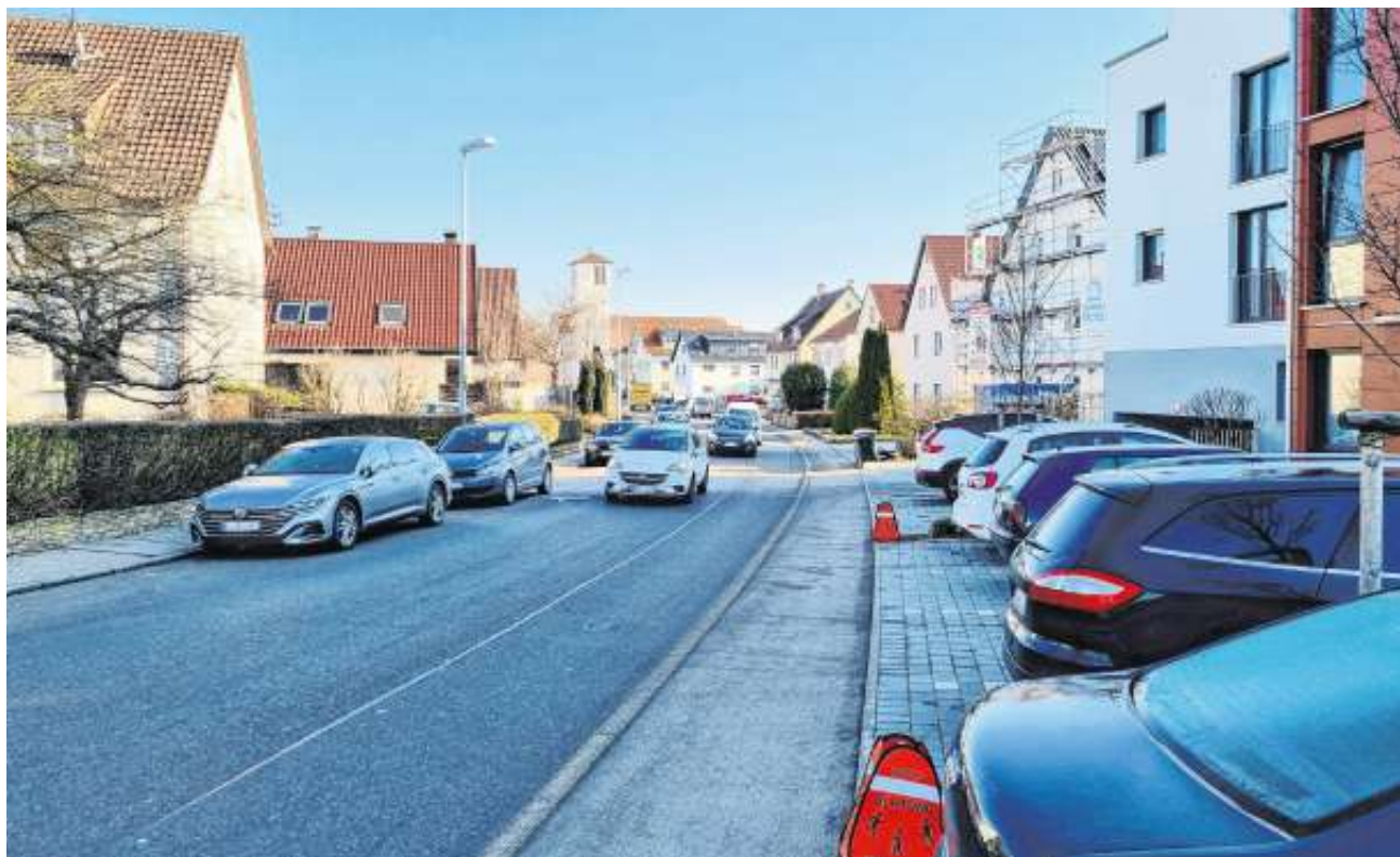
An der Maurener Straße wird es für den zweispurigen Autoverkehr häufig zu eng. Am Bordsteig fordern Anwohner die Autofahrer zum umsichtigen Fahren auf.

Amtliche Mitteilungen der Gemeindeverwaltung