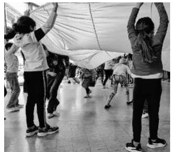
Flinke Füße laufen durch das Zirkuszelt