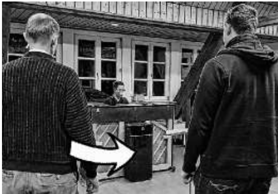
Der Luftreiniger steht vor dem Klavier (siehe Pfeil)

Für die Chorproben in der Fronäckerschule haben wir jetzt einen Luftreiniger. Das Gerät konnte uns freundlicherweise von unserem Chorverband Otto-Elben zur Verfügung gestellt werden. Der wiederum hatte den Luftreiniger mit Fördermitteln des Landes beschafft.