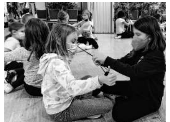
Ruckzuck wird der Ring von der Schnur befreit – Zauberei!