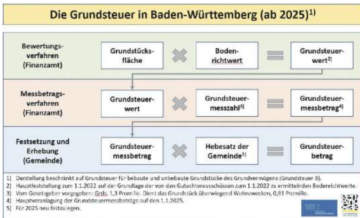
Grundsteuer in Baden-Württemberg ab 2025

Nähere Informationen zum Landesgrundsteuergesetz finden Sie auf der Internetseite des Ministeriums für Finanzen Baden-Württemberg unter https://fm.baden-wuerttemberg.de/de/haushalt-finanzen/grundsteuer/ .