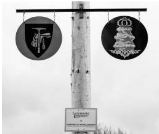
Ein neues Schild zielt ab diesem Jahr den Maibaum