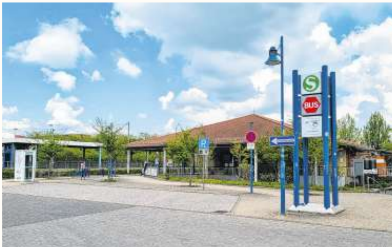
Auf den bisherigen Kurzzeitparkplätzen möchte Smart City | DB einen Mobility Hub für E-Scooter, E-Mopeds, Leihräder und Carsharing einrichten.