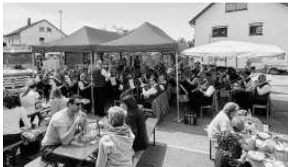
Auftritt unter der Sonnenbedachung

Am vergangenen Sonntag durften wir bei der Muttertagshocketse der FFW Ehningen unseren ersten öffentlichen Auftritt in 2022 präsentieren. Bei der gut besuchten Veranstaltung hat es uns Musiker*innen großen Spaß gemacht, das Publikum zu unterhalten. Ein weiterer Auftritt folgt dann am 26. Mai 2022 in Bempflingen beim dortigen Waldfest des Musikvereins Bempflingen.