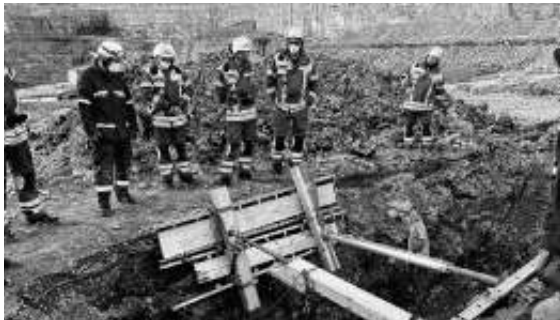
Absicherungsmaßnahmen einer Grube

Wir bedanken uns beim THW Böblingen für den interessanten und kurzweiligen Abend und freuen uns immer über die kameradschaftliche Zusammenarbeit.