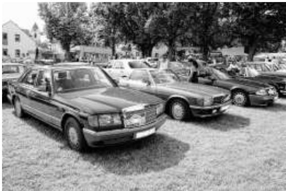
Oldtimertreffen auf der Festwiese für Fzg. aller Art

Solitude Revival auf der legendären Solitude Rennstrecke