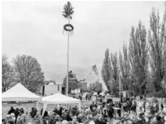
Die Freiwillige Feuerwehr brachte die Monteure gekonnt in Position.