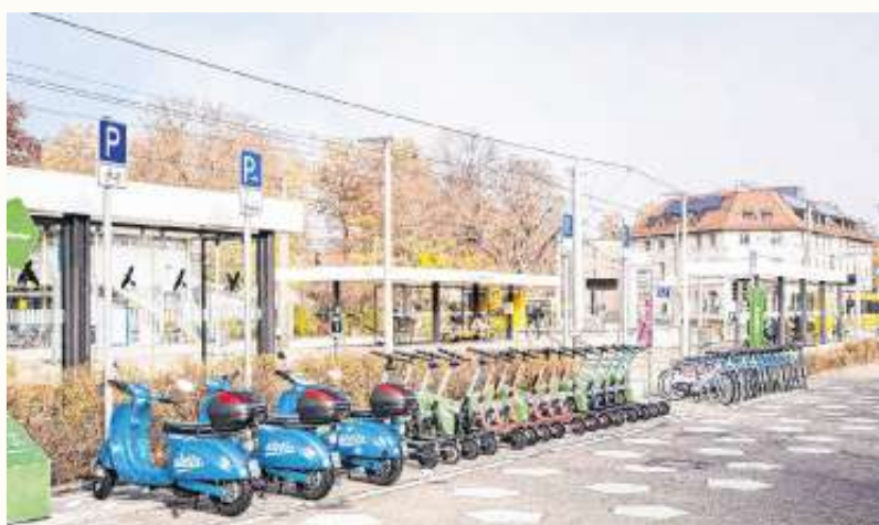
Am Bahnhof Stuttgart-Vaihingen existiert bereits ein Mobility-Hub.

Die Planungen für einen sogenannten Mobility Hub am Bahnhof laufen auf Hochtouren. Nun gab auch der Gemeinderat seine Zustimmung, regte jedoch an, einige Punkte des Konzepts nochmals zu überdenken.