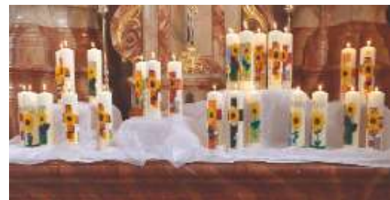
Kath. Kirche Voralberg

Wir feiern Erstkommunion 2022 Jesus unser Licht