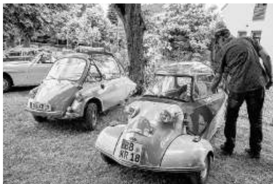
Oldtimertreffen auf der Festwiese für Fzg. aller Art

Solitude Revival auf der legendären Solitude Rennstrecke