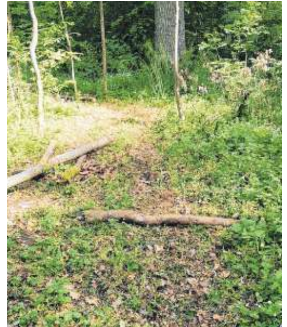
Vom Barfußpfad ist nicht mehr viel übrig geblieben.

Das Eulenwäldchen war im Rahmen einer Eltern-Kind-Aktion hergerichtet worden. Die Freude darüber währte nur kurz.