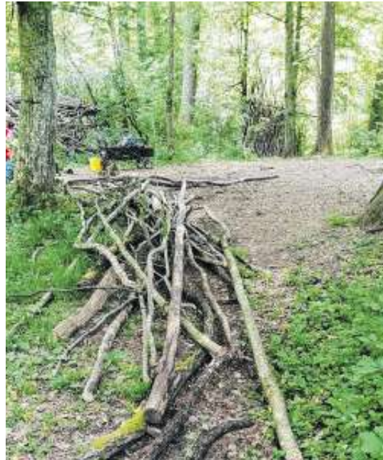
Eine der verwüsteten Tipis.