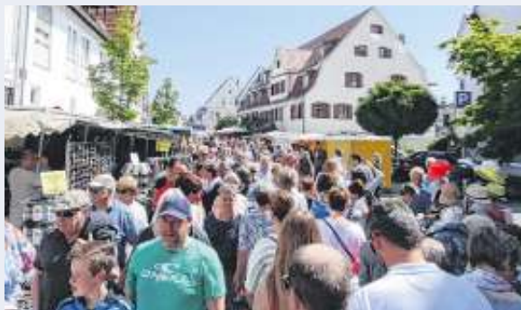
Volle Marktstraßen beim Pfingstmarkt 2018.

Bereits am Samstag, 4. Juni, erfolgt um 18 Uhr der Fassanstich im Festzelt des TSV Ehningen zusammen mit Bürgermeister Lukas Rosengrün. Bis zum Pfingstmontag hat der Sportverein ein buntes Programm zusammengestellt (siehe die Übersicht unten). Pro Tag