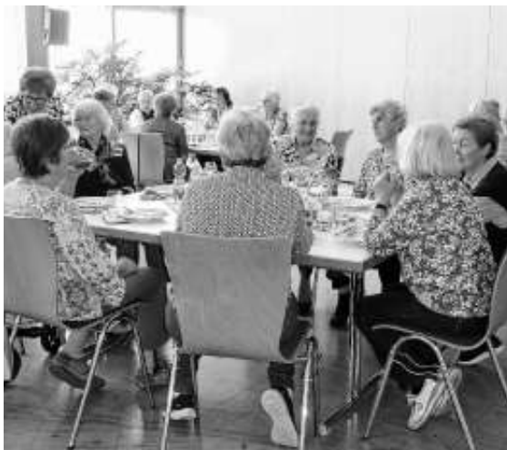
Es gab auch viel zu schwätzen