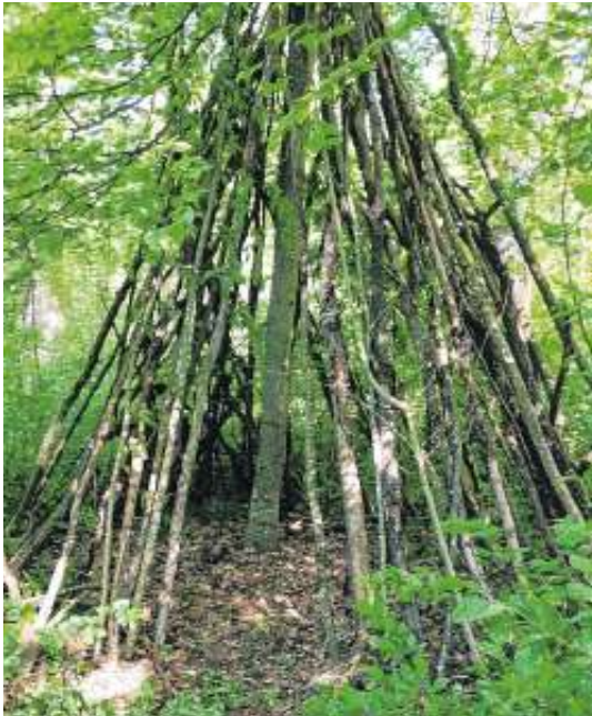
So sah eines der Tipis vor der Verwüstung aus.