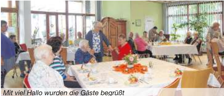
Mit viel Hallo wurden die Gäste begrüßt