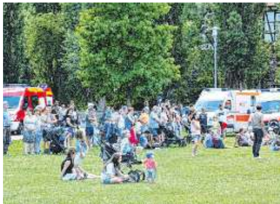
Vielzahl an Zuschauern