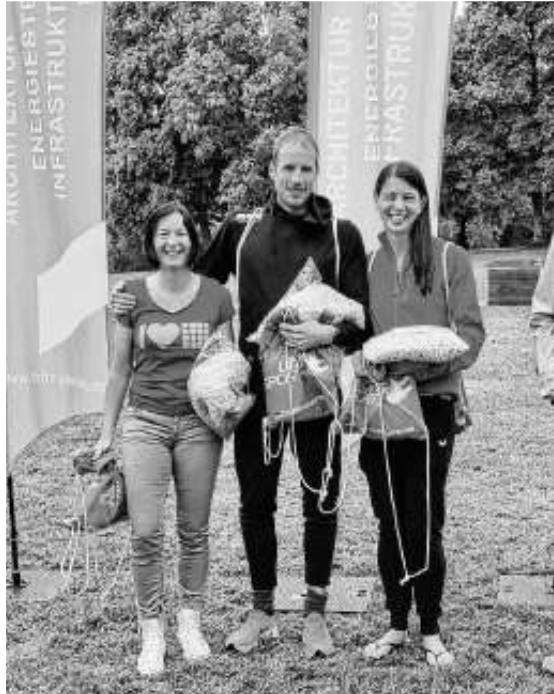
Erster Platz für das Team

Am Samstag versuchten sich die Burkhardts in einer anderen Disziplin: Beim Openwater-Schwimmen durchquerten sie erfolgreich den Bodensee auf der 5 km langen Strecke von Konstanz nach Meersburg.