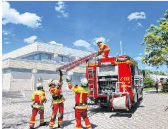
Leiterentnahme von Fahrzeug