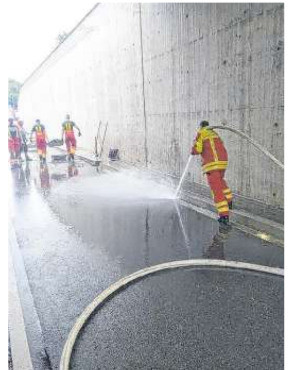
Reinigung der Unterführung

Während den Rettungsmaßnahmen musste die Strecke vollständig gesperrt werden. Ebenfalls an der Einsatzstelle waren mehrere Fahrzeuge der Polizei Ludwigsburg.