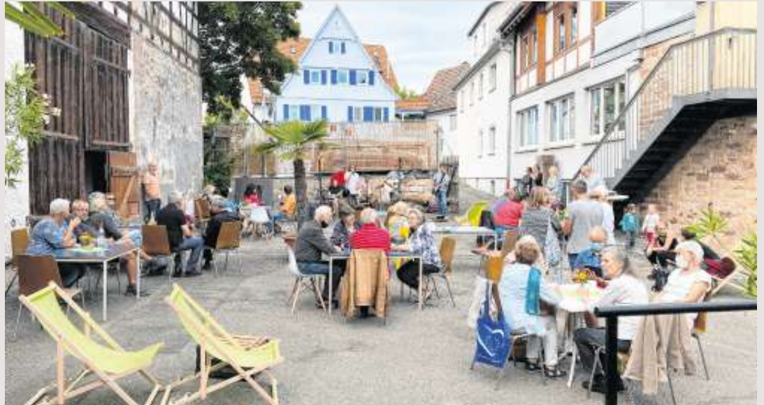
Das Café im Zehntscheuerhof im Sommer 2020.