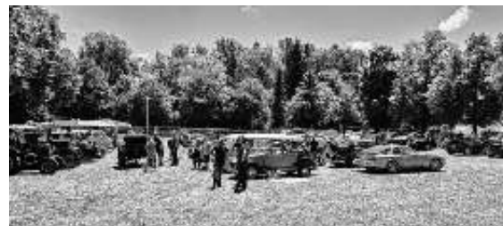
Oldtimertreffen auf der Festwiese

Solitude Revival auf der legendären Solitude Rennstrecke