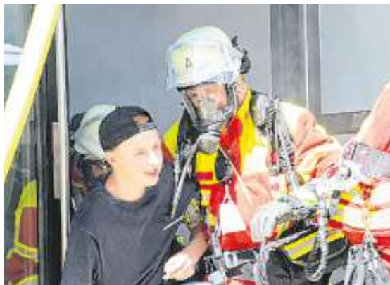
Personenrettung unter Atemschutz