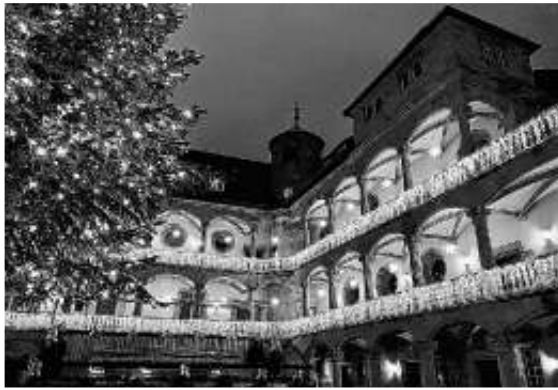
Impression aus dem alten Stuttgarter Schloss

Anschließend lockte der Stuttgarter Weihnachtsmarkt, und sowohl Sängerinnen und Sänger als auch die Zuhörer nutzten die Gelegenheit, um einen Bummel durch die Verkaufsstände zu machen oder einen Glühwein zu trinken.