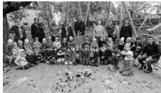
Wir sagen Danke!