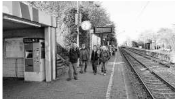
Mit der S-Bahn nach Beutelsbach

Näheres auf unserer Homepage www.seniorenwanderer-ehningen.de