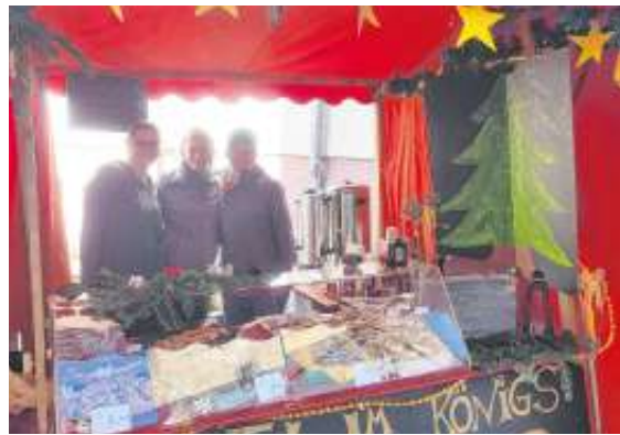
Der Stand wurde weihnachtlich dekoriert.