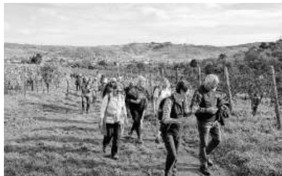
Wanderung durch die Weinberge zum Weingut Zimmer