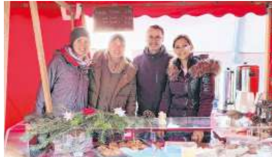
Ein Teil der tüchtigen Helfer*innen