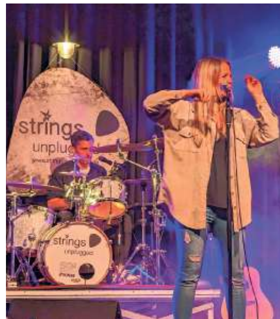
Musikalischer Abschluss mit „Strings Unplugged“

Nach den zahlreichen Ehrungen folgte ein Live-Auftritt der Band „Strings Unplugged“. Das Herrenberger Quartett bot den Gästen zu den Hits von Fleetwood Mac über Tracy Chapman, Pink Floyd bis hin zu Sarah Connor einen musikalischen Abschluss, der zum Tanzen animierte.