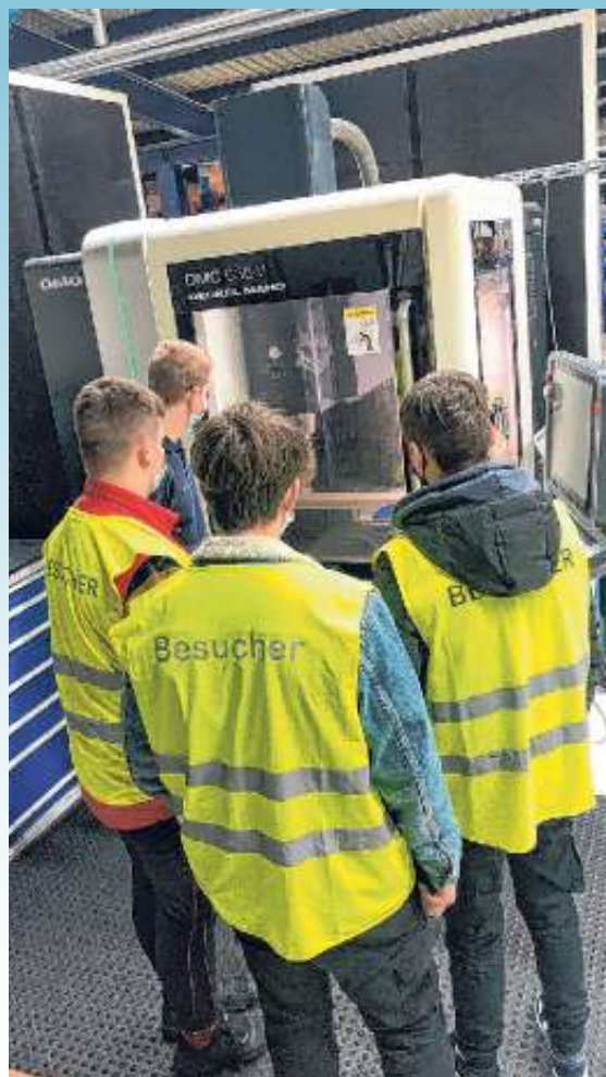
Betriebserkundung im Rahmen des Technikunterrichtes