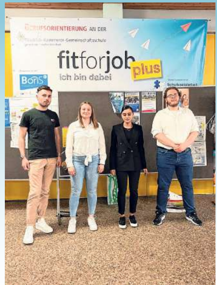
Die vier Ausbildungsbotschafter der Handwerkskammer