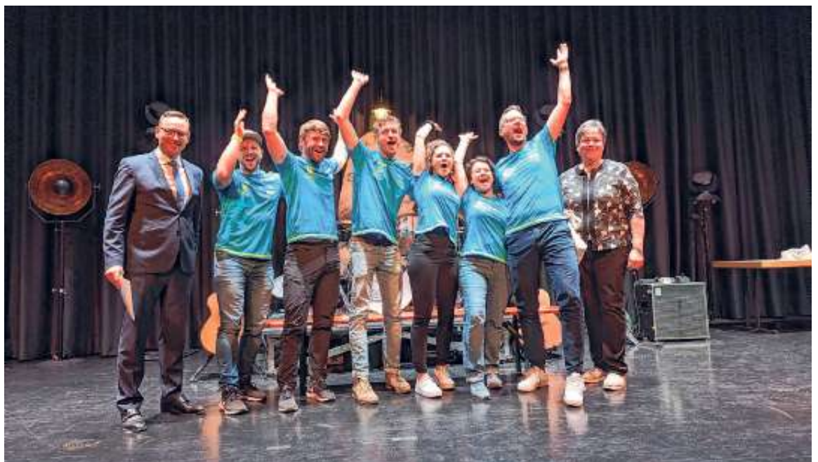
Ehrung der Volleyballmannschaft des TSV Ehningen Abteilung Breitensport