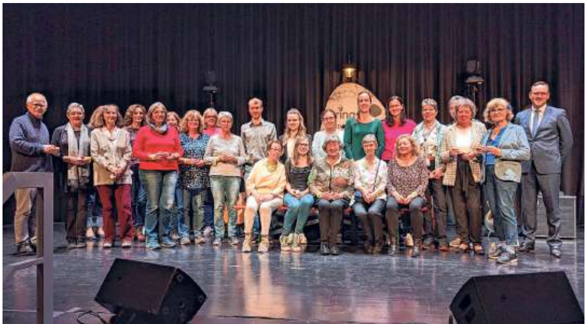
Team und Ehrenamtliche der Bücherei

Bürgerbeteiligung, Flüchtlingsbegleitung, Hausaufgabenhilfe, Café International, Interkultureller Gemeinschaftsgarten, Lesen auf der Empore, Bilderbuchkino, Lesepatenschaft, Kino im Theaterkeller, Unterstützung bei Ferienprogrammen und Tagesfreizeiten, INGA-Besuchsdienst, PC-Lernwerkstatt, uvm. - es folgte anschließend eine lange und in diesem Artikel nur verkürzt wiedergegebene Liste an Gebieten, in denen sich viele Ehningerinnen und Ehninger im vergangenen Jahr für das Gemeinwesen engagiert haben. Auffällig war dabei, dass einige Geehrte dabei wiederholt die Bühne betraten. Eine Besonderheit in diesem Jahr war, dass auch diejenigen Ehningerinnen und Ehninger geehrt wurden, die sich im Zuge der Corona-Pandemie ehrenamtlich engagiert hatten, z.B. beim Betrieb des Schnelltestzentrums oder bei der Einhaltung und Durchsetzung der Hygiene-Regeln bei Fußballspielen des TSV Ehningen.