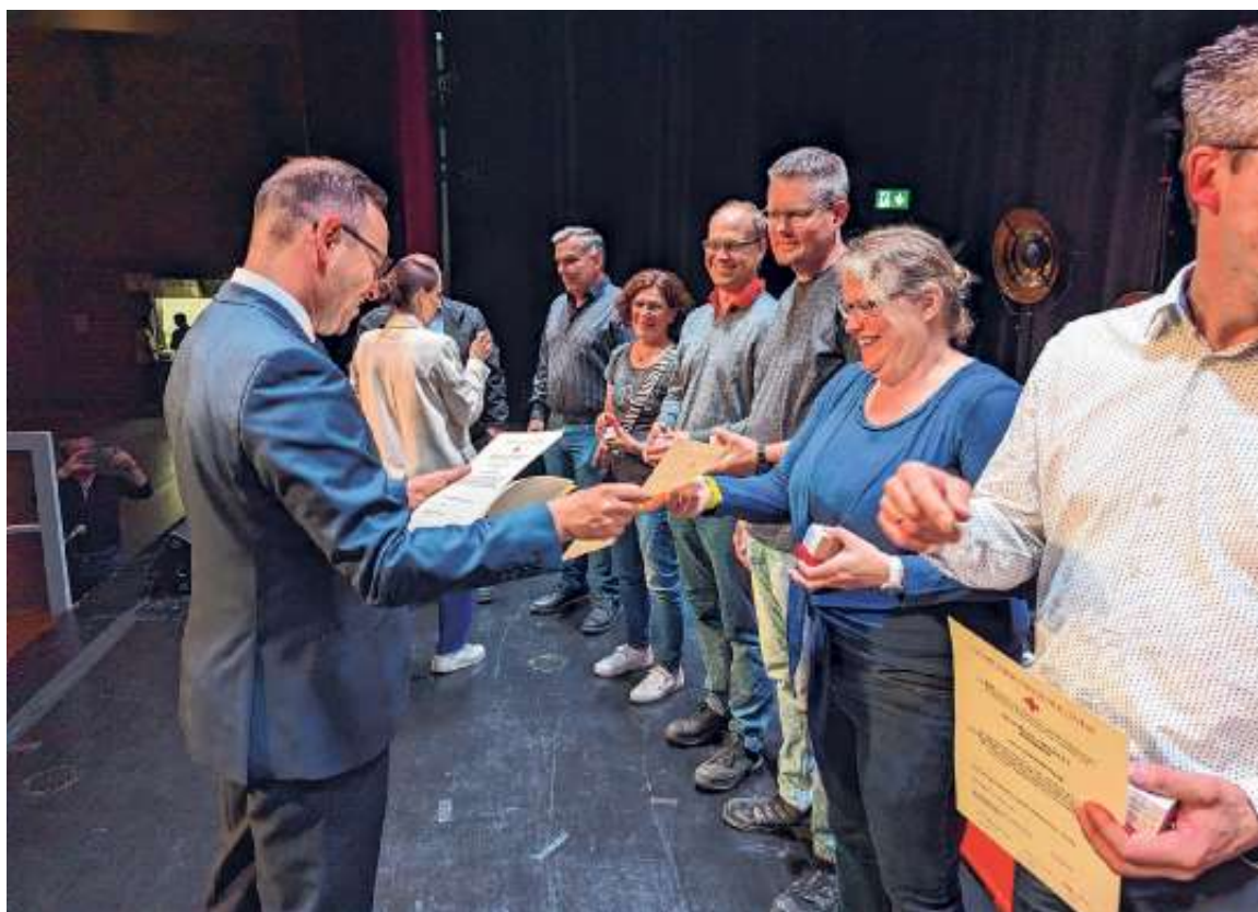
Die Geehrten erhalten ihre Urkunde und ihr Präsent

Die Fotos aller Geehrten finden sich im dazugehörigen Online-Artikel auf der Gemeindehomepage ( www.ehningen.de ). Sie können dort bis zum 5. Juni heruntergeladen werden.