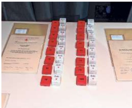
Urkunden, Ehrennadeln und Präsente für die geehrten Blutspenderinnen und Blutspender

Zum Abschluss durften beim diesjährigen Ehrungsabend die etwa 400 Gäste in der Turn- und Festhalle