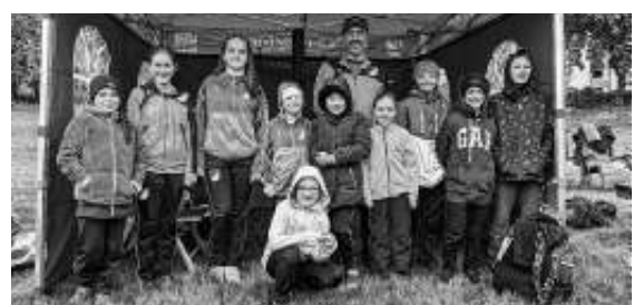
Die Schwimmer des TSV Ehningen in ihrem Zelt samt