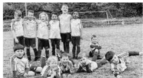
Bambinis in Deufringen