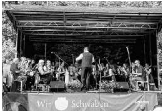
Der MVE auf der Bühne in Musberg