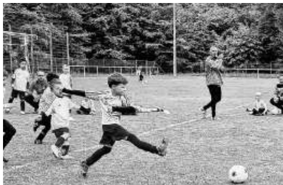
Bambinis in Mönchberg

Lasst uns weiter wachsen! Jeder ist uns jederzeit herzlich willkommen!