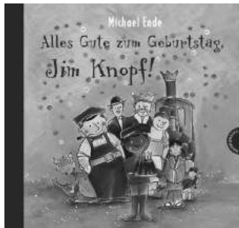
Die beliebte Vorlesestunde für Kinder der Klassenstufe 1.