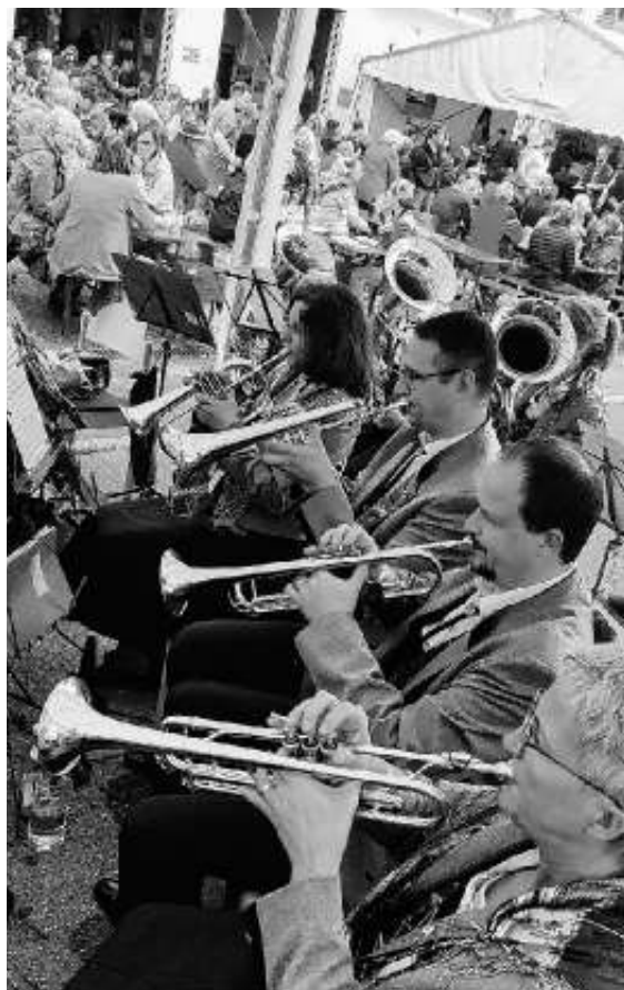
Das Trompetenregister im Einsatz

In diesem Monat war die Kapelle bei zwei Auftritten gefordert. Bei der FFW Ehningen und beim Haufest des Musikvereins Musberg.