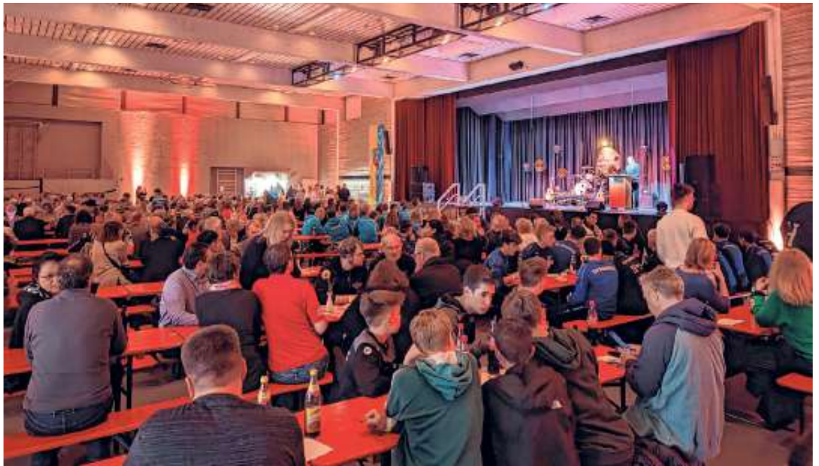
Eine volle Turn- und Festhalle