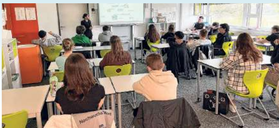
Vorstellung der verschiedenen Ausbildungsberufe

Nach zwei Schulstunden war die Aktion leider schon wieder vorbei und wir freuen uns auf das nächste Mal.