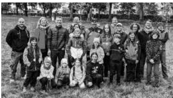
Gruppenfoto des TSV Ehningen