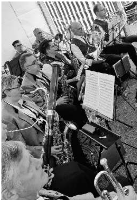
Musikalische Umrahmung bei der FFW Ehningen