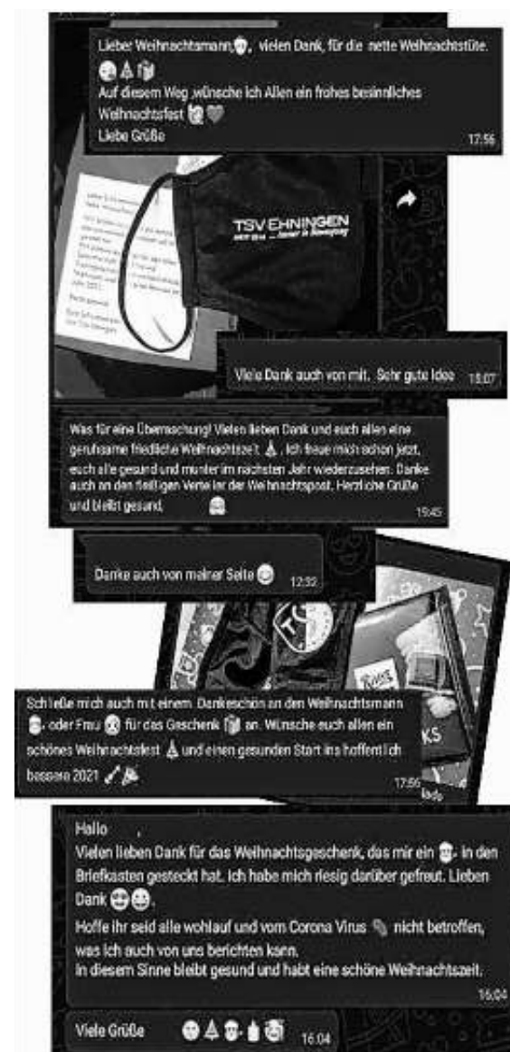
Freudige Reaktionen auf unsere Weihnachtsaktion