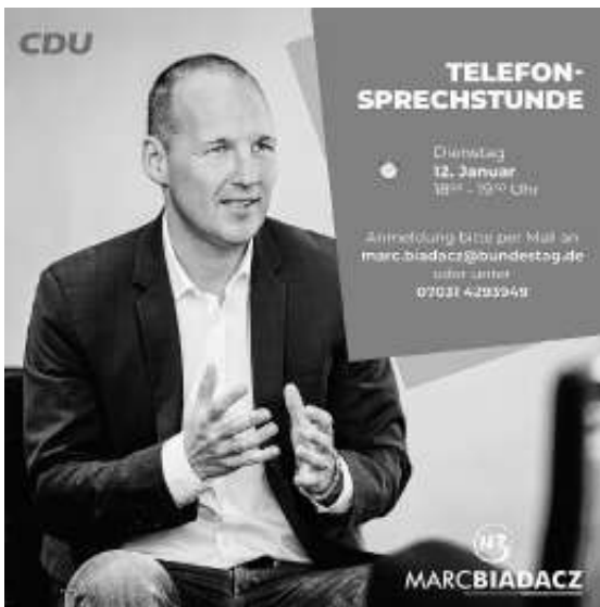
Der CDU-Bundestagsabgeordnete Marc Biadacz lädt zu seiner Telefonprechstunde.

Die Telefonprechstunde findet am Dienstag, den 12. Januar 2021, von 18.00 bis 19.30 Uhr statt. Um unnötige Wartezeiten zu vermeiden, wird um Anmeldung unter der Telefonnummer (0 70 31) 4 29 39 49 oder per E-Mail an marc.biadacz@bundestag.de gebeten. Bei der Anmeldung sollte eine Telefonnummer mitgeteilt werden, die der Abgeordnete ausschließlich dafür nutzt, um im Rahmen der Telefonprechstunde die angemeldeten Bürgerinnen und Bürger anzurufen.