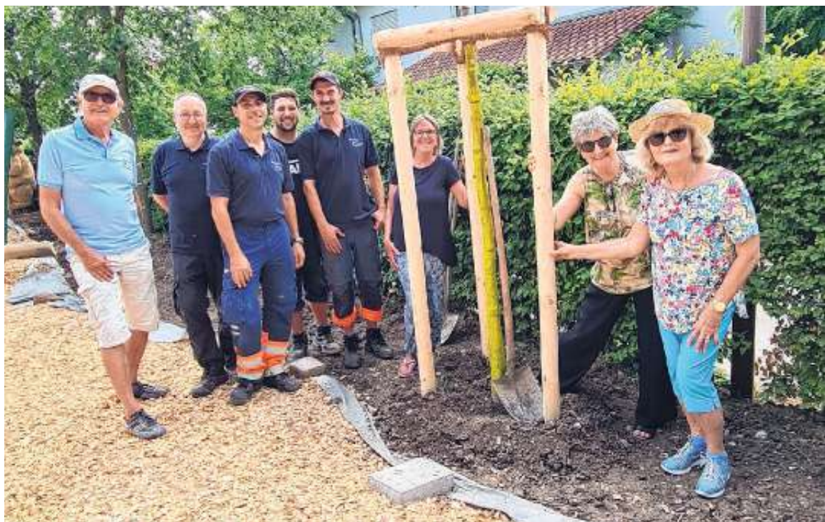
Baumbepflanzung auf dem Spielplatz Herdstelle

Am Mittwoch letzte Woche wurden 3 Bäume am neuen Spielplatz in der Herdstelle vom Bauhof gepflanzt. Die Tauschbörse und das Kino-Team haben aus ihrer Spendenkasse 2 Bäume gespendet, einen Kastanienbaum und eine Vogelkirsche.