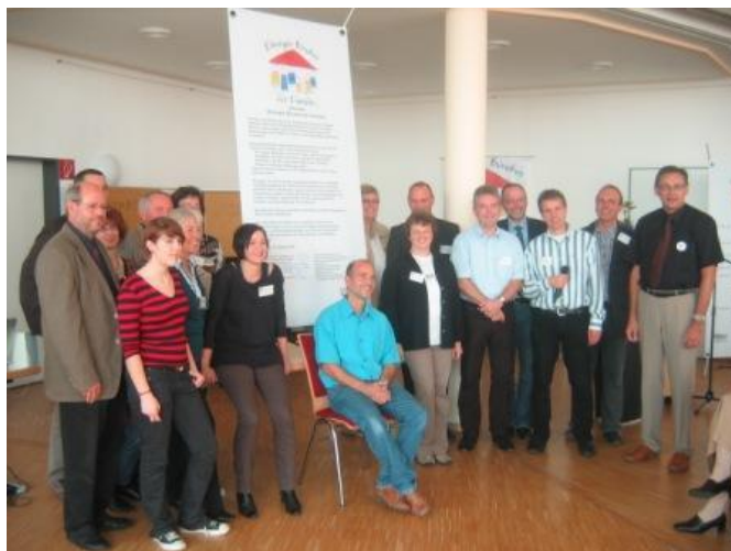
Die Unterzeichner der Gründungsurkunde

Das Ehninger Bündnis für Familien gründete sich am 12. Oktober 2008 im Rahmen einer feierlichen Auftaktveranstaltung. Dabei präsentierten die Planungs- und Arbeitsgruppen des Bündnisses bereits erste Ergebnisse der Bündnisarbeit und konnten das Engagement weiterer Akteure gewinnen. Ein Spiel- und Unterhaltungsprogramm für Groß und Klein, u. a. mit Musik, einer Ideenbörse und einer „Bündnisbutton“-Maschine, rundete den Bündnisauftakt ab.